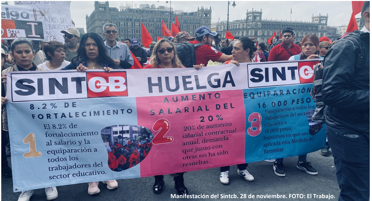
Manifestación del Sintcb. 28 de noviembre.