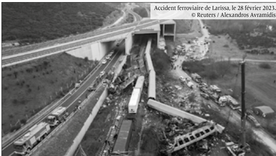
Accident ferroviaire de Larissa, le 28 février 2023.

Du côté des luttes ouvrières, diverses luttes locales ont eu lieu, en particulier contre les accidents du travail qui se multiplient en raison de la déréglementation. Mais l'usine autogérée Viome a été investie par la police après dix ans d'occupation popularisée au-delà des frontières. Sur le plan national, si la grève nationale et les manifestations du 21 septembre ont été assez suivies, il faut noter que la GSEE (Confédération syndicale du secteur privé), à direction PASOK, n'avait pas appelé, alors qu'il s'agissait de refuser dans la rue la loi franchissant une étape dans la casse des droits des travailleurs/euses, vers un retour au 19 e siècle.