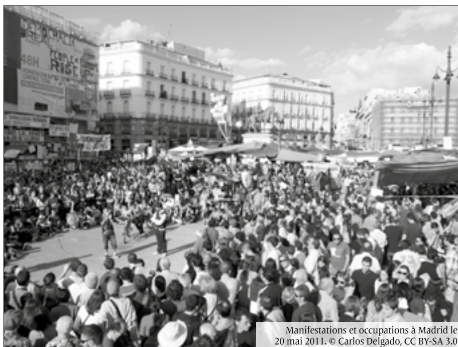
Manifestations et occupations à Madrid le 20 mai 2011.

La nature du «grand bond» chinois des trente dernières années est capitaliste. Héritier d'une grande révolution sociale et d'un tournant restaurateur à partir des années 1980, indispensable à la refonte néolibérale du monde (menée en partenariat avec les États-Unis et leurs alliés), l'impérialisme chinois présente des caractéristiques particulières, comme tous les impérialismes. Il repose sur un capitalisme étatique planifié, centralisé dans le PCC et les forces armées chinoises, avec des politiques développementalistes classiques, où de nombreuses grandes entreprises sont des joint-ventures entre des entreprises appartenant à l'État ou contrôlées par l'État et des entreprises privées. Son impérialisme est encore, bien sûr, en construction, mais celle-ci est très avancée. Au cours des dix dernières années, la Chine a fait un bond en avant dans l'exportation de capitaux et est devenue le pays qui dépose et enregistre le plus de brevets au monde. Au cours des deux dernières années seulement, la Chine est devenue davantage un exportateur qu'un importateur de capitaux, en mettant l'accent sur ses participations dans des sociétés énergétiques, minières et d'infrastructure dans les pays néocoloniaux (Asie du Sud-Est et Asie centrale, Afrique et Amérique latine). Elle investit de plus en plus dans l'armement et franchit avec véhémence les limites – en particulier celles de la «ligne en neuf traits», autour de Taiwan