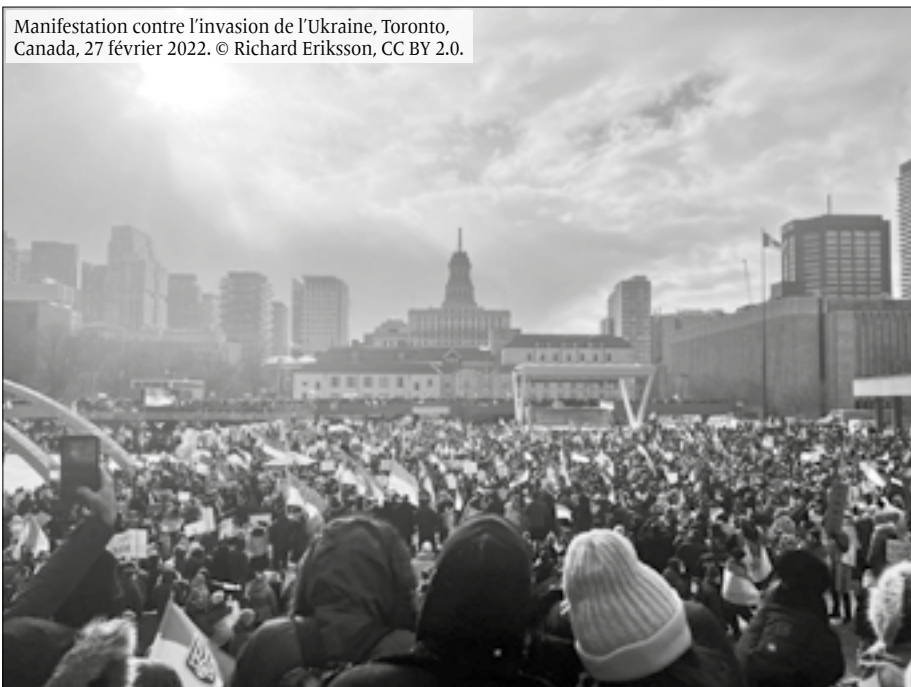
Manifestation contre l'invasion de l'Ukraine, Toronto, Canada, 27 février 2022.