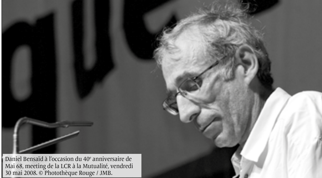
Daniel Bensaïd à l'occasion du 40 e anniversaire de Mai 68, meeting de la LCR à la Mutualité, vendredi 30 mai 2008.

À quoi fait écho la formule de Trotski ramenée dans les années trente, face au nazisme et à la réaction stalinienne, la crise de l'humanité à sa crise de direction révolutionnaire.