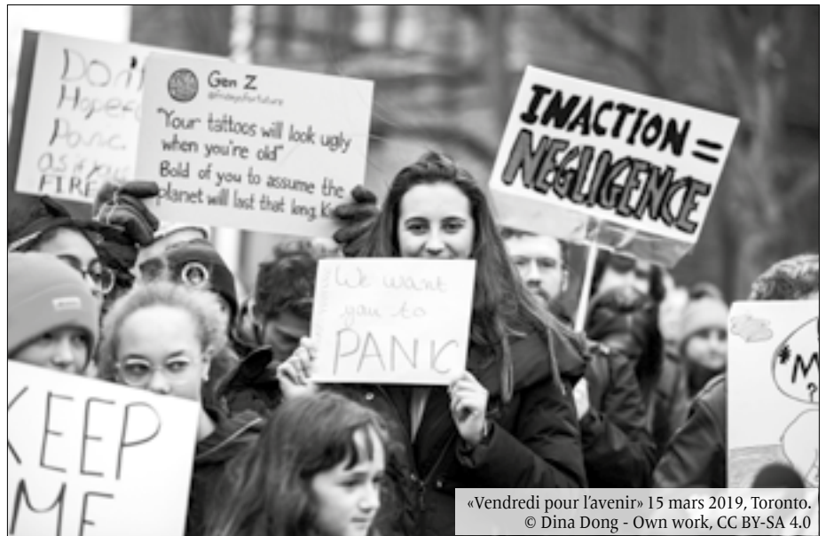
«Vendredi pour l'avenir» 15 mars 2019, Toronto.

Le lien entre la guerre en Ukraine (avant même l'explosion du conflit en Palestine) et la stagnation économique a aggravé la situation alimentaire critique des personnes les plus pauvres dans le