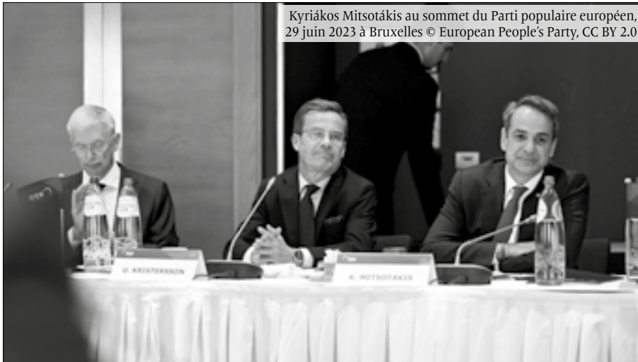
Kyriákos Mitsotákis au sommet du Parti populaire européen, 29 juin 2023 à Bruxelles