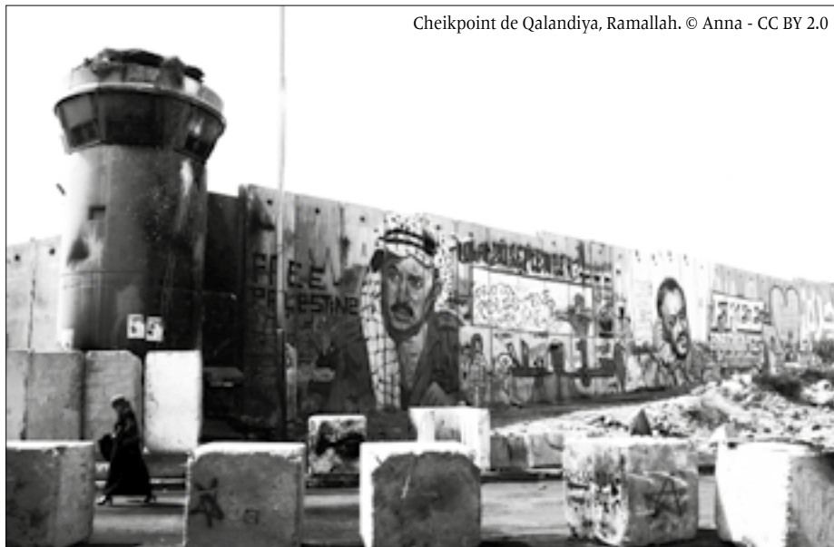
Cheikpoint de Qalandiya, Ramallah.

israéliens, qui étaient privilégiés avec un État ethno-suprémiste pour eux-mêmes dans 80 % de la Palestine, de le partager avec le peuple palestinien sur une base démocratique, comme le proposait l'OLP.