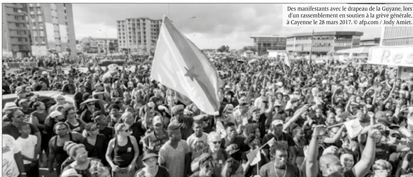
Des manifestants avec le drapeau de la Guyane, lors d'un rassemblement en soutien à la grève générale, à Cayenne le 28 mars 2017.