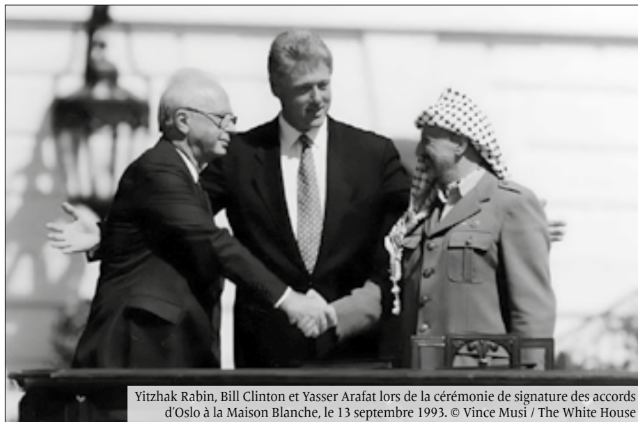
Yitzhak Rabin, Bill Clinton et Yasser Arafat lors de la cérémonie de signature des accords d'Oslo à la Maison Blanche, le 13 septembre 1993.

80 % des «Gazaouis» ne sont pas des «Gazaouis»: ce sont des réfugiés et leurs descendant-es qui ont été expulsés de ce qu'est devenu Israël en 1948.