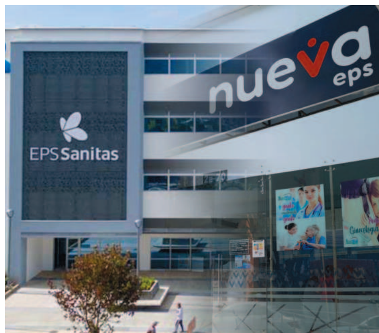
LA INTERVENCIÓN DE las dos EPS obedeció a que incumplían con requisitos financieros.

9. Planes y pólizas: los planes de medicina prepagada o las pólizas de salud seguirán funcionando con normalidad. ■