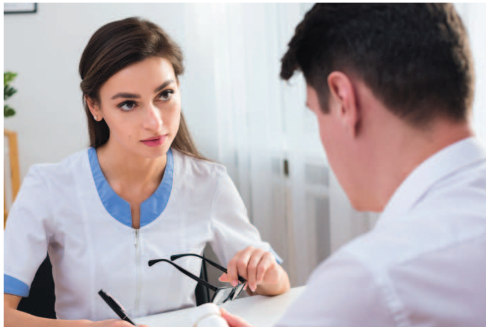
POR ACUERDOS CON EPS vuelve el Proyecto de reforma a la salud para ser considerado nuevamente por el Congreso de la República.

Este nuevo rol y las responsabilidades que conlleva la función de las EPS como Gestoras de Salud y Vida, además de la interacción con otros actores y competencias del sistema, permitió la elaboración de una propuesta de transformación concertada que será puesta a consideración al Congreso en los próximos días.