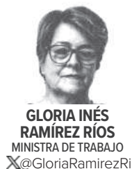
GLORIA INÉS RAMÍREZ RÍOS MINISTRA DE TRABAJO X@GloriaRamirezRI

la sociedad. Con la reforma pensional, hemos propuesto un sistema de pilares pensado para resolver los problemas que en la actualidad tiene el sistema: es desigual, no pensiona, y no es incluyente. La reforma está pensada para ampliar la cobertura en protección para la vejez a las poblaciones más empobrecidas y vulnerables.